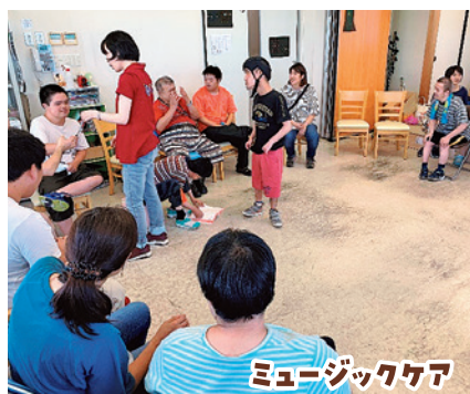
ミュージックケア

音楽療法・ミュージックケア・足浴・フィットネスなどさまざまな活動を取り組んでいます！月に1回、また月2回の取り組みを仲間たちは、とても楽しみにしています。作業と違った仲間の一面を知ることができるので、職員も楽しみです！！