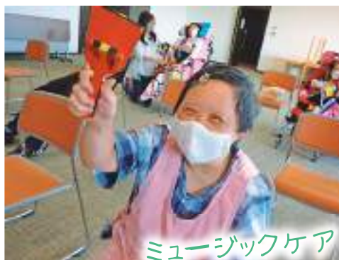
ミュージックケア